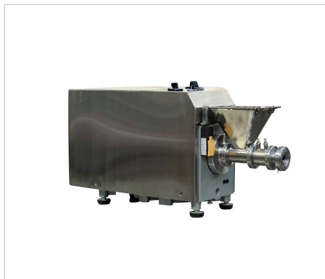
Type BV32 1E ou 2E avec vitesse variable

La vitesse d'extrusion est variable de 10 à 100%.